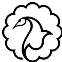
مرکز رشد بین المللی المصطفی

ماده ۶۴) نام و نشان رسمی مرکز به این شکل است: